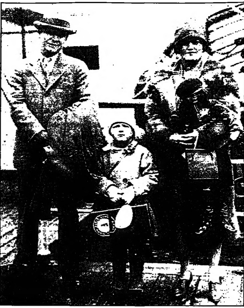
فتزجرالد مع زوجته زيادا وابنته

في منطقة مونتيرناس في قلب باريس تحرق فتزجرالد على عرشه في وقت مبكر من حياته